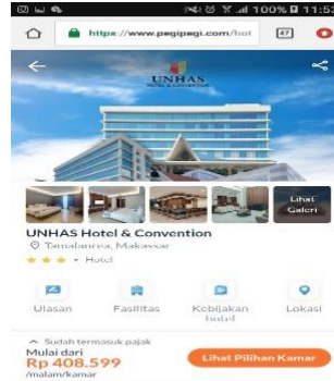
Gambar 3 Pegi – pegi Unhas Hotel dan Convention