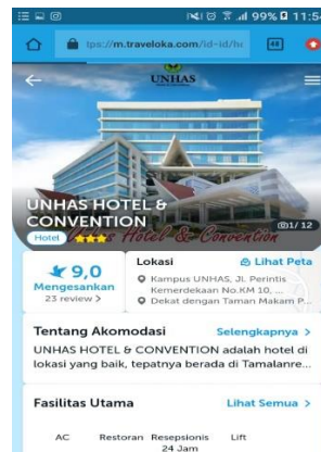
Gambar 4 Traveloka Unhas Hotel dan Convention