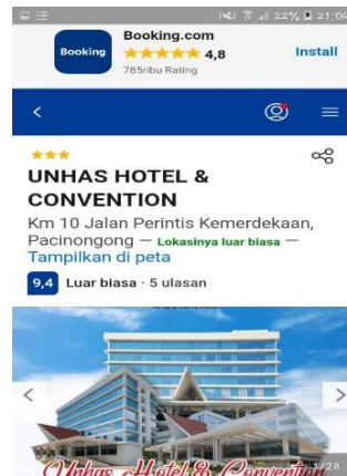
Gambar 1 Booking.com Unhas Hotel dan Convention