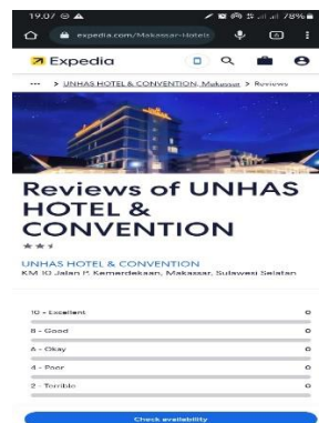
Gambar 5 Ekspedia Unhas Hotel dan Convention