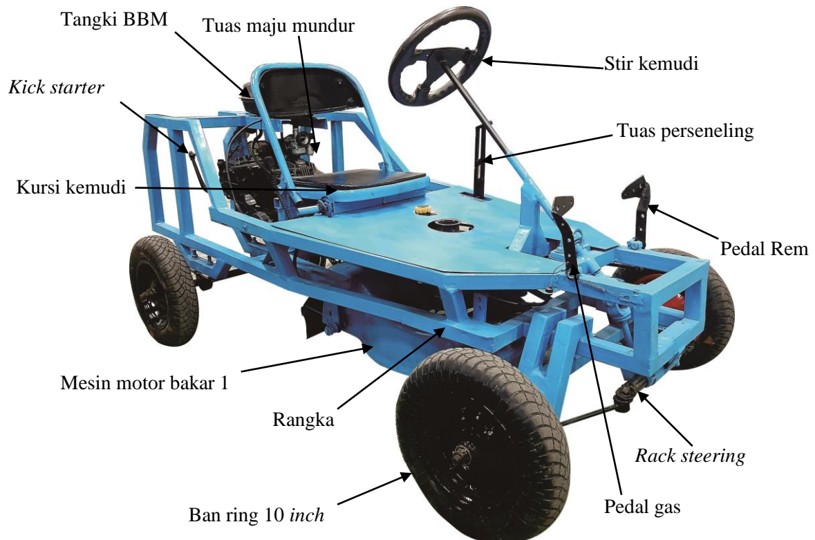
Gambar 3. Modifikasi mesin pemotong rumput

Mesin motor bakar 2 yang berfungsi sebagai penggerak roda belakang. Prinsip kerja mesin motor bakar 1 adalah berputar pada sumbu vertikal dengan kecepatan tinggi dan memutar rumah pisau, pisau yang berputar searah jarum jam dan mesin motor bakar 2 sebagai penggerak poros horizontal pada roda belakang yang ditransmisikan oleh sprocket dan chain .