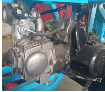
Gambar 5. Motor bakar 2