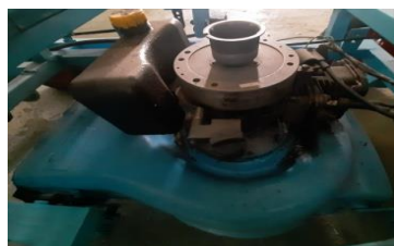
Gambar 4. Motor bakar 1